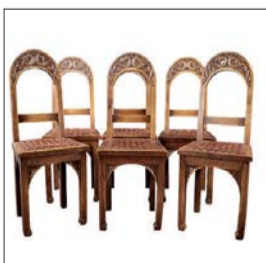
Suite de 6 chaises en chêne par JACQUES PHILIPPE, rare travail du mouvement SEIZ BREUR