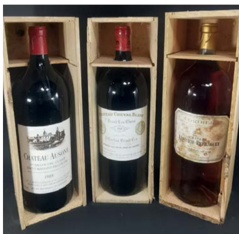
Grands crus en caisse bois, grands millésimes.

Pour expertiser et inclure des lots dans la vente, contactez l'Etude