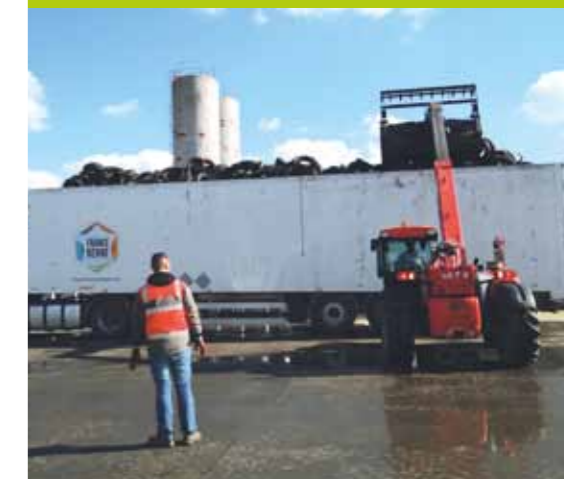
Chargement d'un semi-remorque de pneumatiques à St Pierre des Landes

En collaboration avec le Département de la Mayenne et la Chambre d'agriculture, la Communauté de communes de l'Ernée a organisé une première collecte de pneumatiques usagés en début d'année. Ce fût une grande réussite avec plus de 200 tonnes de pneumatiques collectés en 4 jours.