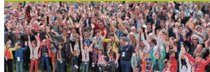
Rassemblement régional à Ste Suzanne des familles participantes au défi